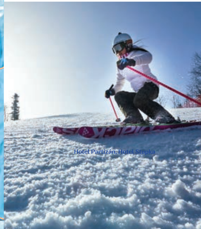
Hotel Partizán, Hotel Stupka

Akčná zima v Banskobystrickom kraji trvá 350km